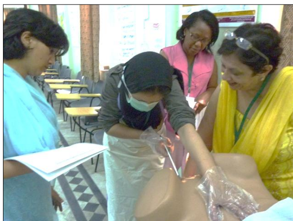
2011 Atelier régional de DIUPP, Rajasthan, Inde

Les prestataires de santé des centres de santé périphériques, où les mères peuvent aller pour leur visite postnatale, devraient aussi recevoir une orientation sur les DIUPP. Par exemple, à El Salvador, les mères peuvent aller à un hôpital de district pour les soins prénatals et l'accouchement. Une fois la grossesse et l'accouchement passés sans problème, elles peuvent retourner à leur centre local de santé primaire. Dans un des sites du projet, où les prestataires des centres de santé périphériques n'étaient pas orientés sur les DIUPP, les mères se rendaient souvent dans de petits postes de santé pour les visites de suivi. Le personnel de PSI a cité une conséquence de la non orientation, "Quand les prestataires des petits postes de santé ont effectué la visite de postpartum à six semaines et ont découvert les fils de DIU in situ, ils les ont tirés." 11